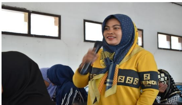
Gambar 5. Sesi Tanya Jawab Dengan Peserta