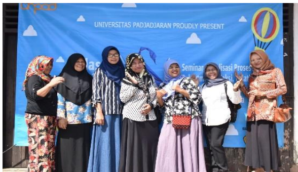
Gambar 6. Sebagian kecil Peserta yang Hadir