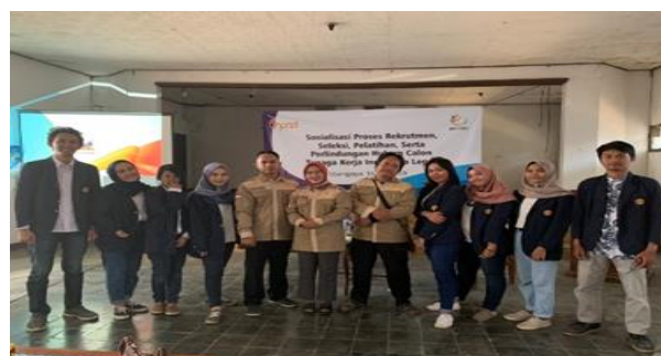
Gambar 2. Tokoh Masyarakat Ujung Jaya Bersama Mahasiswa PKM Universitas Padjadjaran