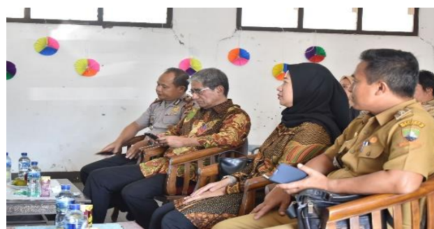
Gambar 3. Kapolsek Ujung Jaya, Kepala BP3TKI Bandung, Dosen FEB Unpad, dan Camat Ujung Jaya saat Menghadiri Kegiatan