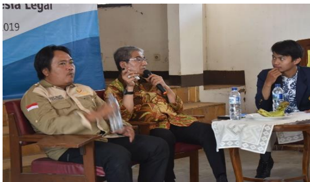
Gambar 4. Penyampaian Materi Oleh Pembicara